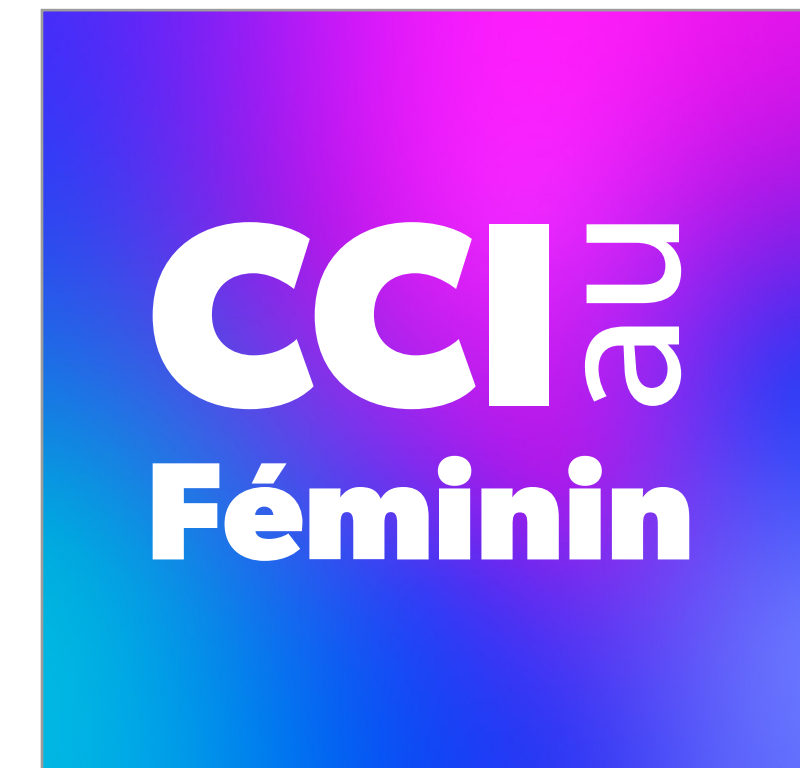
PHOTO DE PROFIL